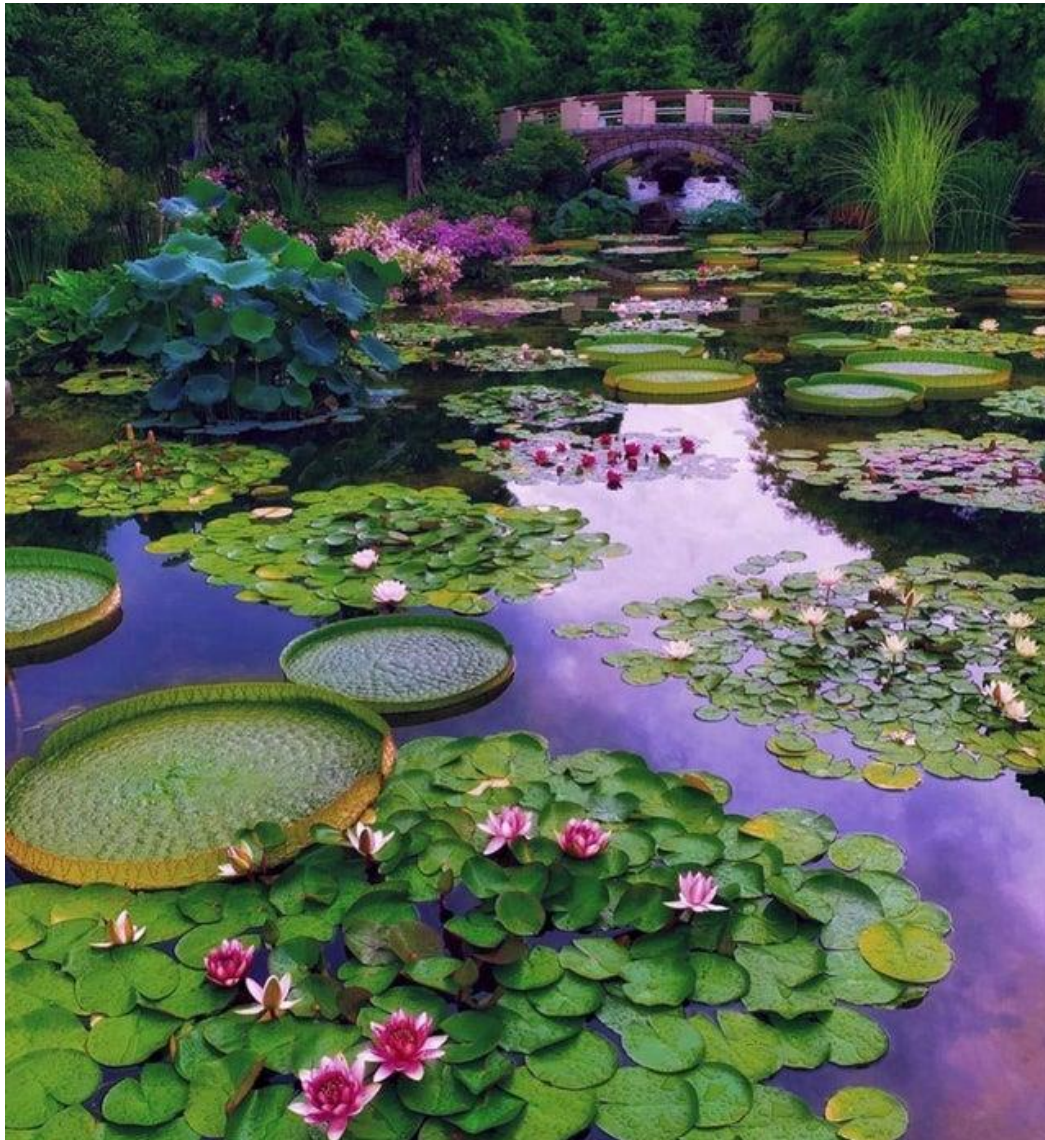
Mizunomori Water Botanical Garden, Shiga Prefektur, Japan.

Tid og sted: Lørdag 15. oktober klokken 11.30 i Kulturhistorisk museums lokaler i Frederiks gate 29