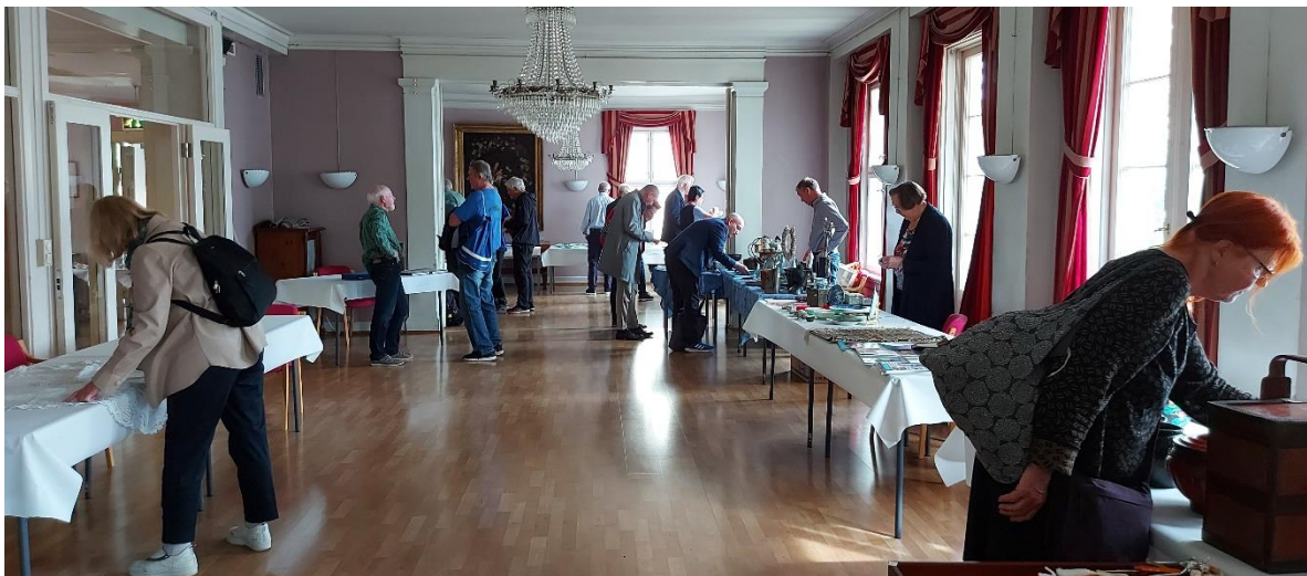
Porselen- og menneskemøter fra salgsmessen 2022.