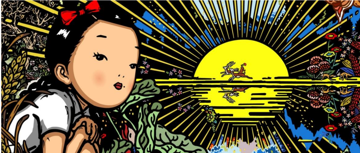
Bu Hua, The Light of Love (utsnitt), 2019

Vil du heller legge turen sørover kan du besøke Katrinetorp landeri ved Skåne, et empireanlegg med hager og engelsk landskapspark. Der vises sommerutstillingen «Jakten till Ostindien», om det Svenska Ostindiska Companiet og de rikdommer de brakte med seg fra Kina. Les mer her: Evenemang - Malmö stad (malmo.se)