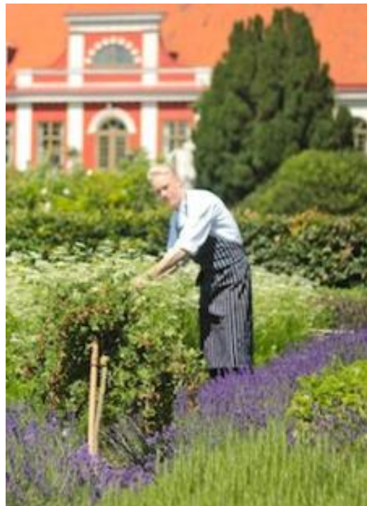
Fra Katrinetorp landeri, utstilling, og kaféens chef i kjøkkenhagen