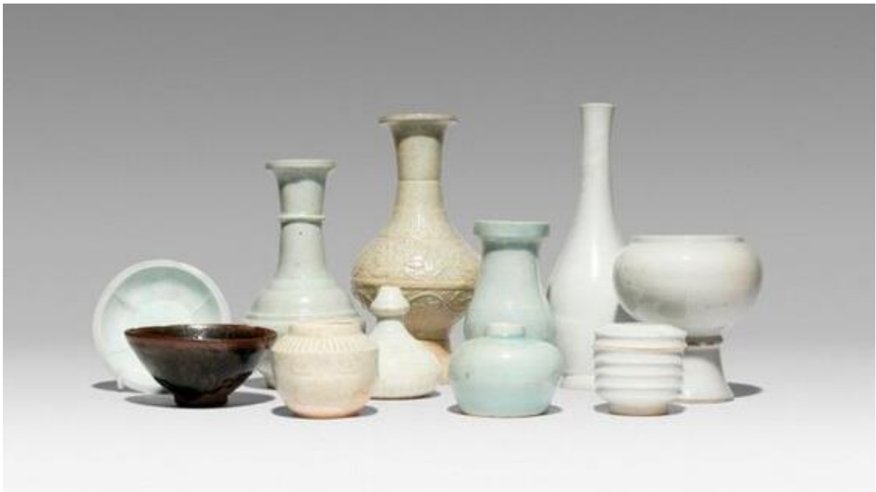
Keramikk fra Song-dynastiet og senere.

Tid og sted: onsdag 7. september klokken 19 i Røde sal på Schafteløkken