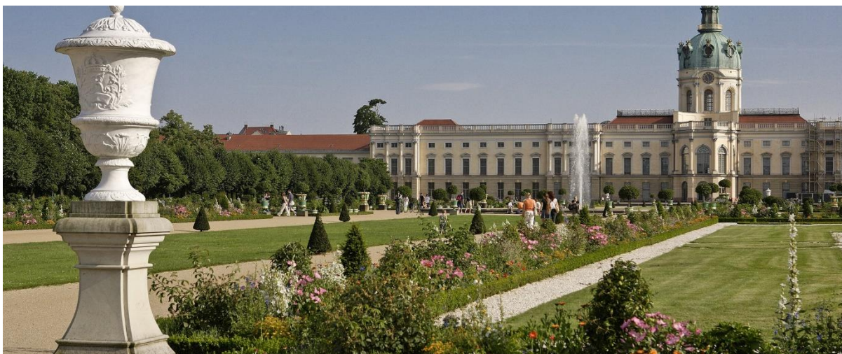
Charlottenburg slott.

Vi vil også arrangere en dagstur i juni eller august, men dette kommer vi tilbake til.