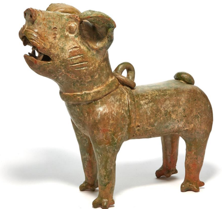
Hundefigur i keramikk. Innkjøpt av Kulturhistorisk museum i 2023 på Blomqvist, fra Strømstads samling. Han-dynastiet (206 f.v.t – 220 e.v.t). Kina. H: 32 cm

Tid og sted: Lørdag 8. juni klokken 12 i St. Olavs gate 29, Kulturhistorisk museums lokaler