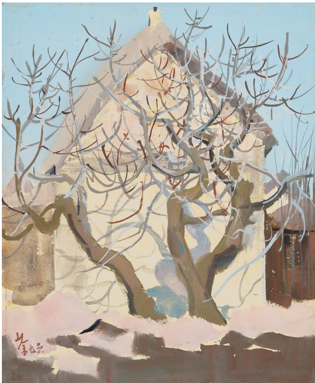
Wu Guanzhong (1919-2010) Winter scene, fig tree.

Mens mange av oss ser frem til lysere tider, planlegger vi i NSOK vårprogrammet!