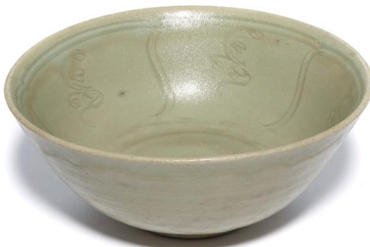
Skål, Nordlig Song, Kina (960–1127). Diameter 16 cm.