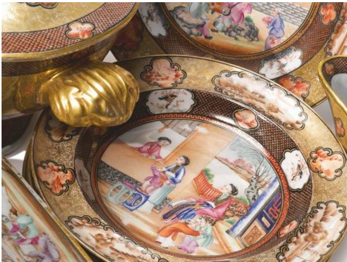
Kinesisk eksportporselen, Rockefeller-mønster, Qianlong periode, ca 1810