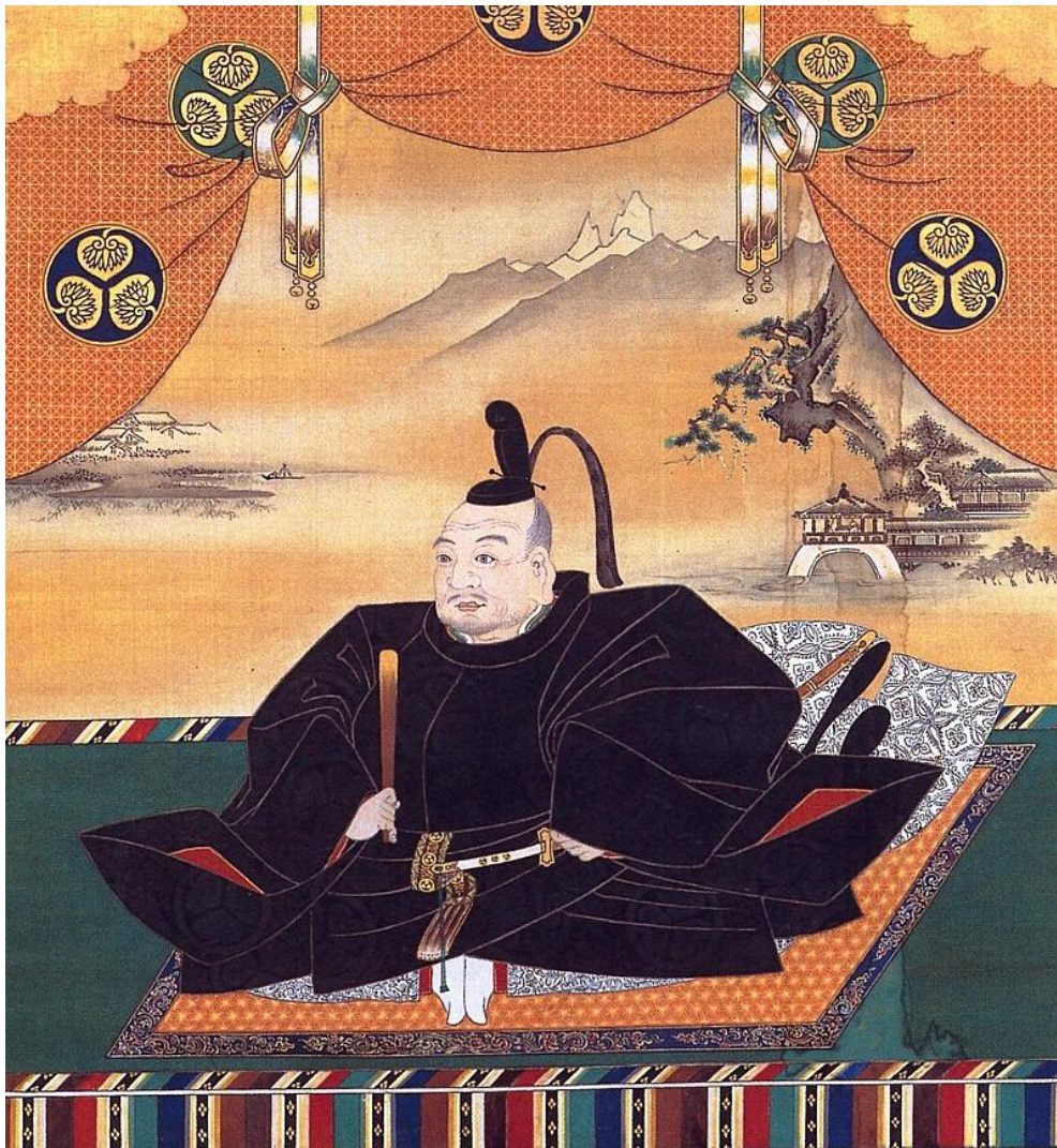
Tokugawa Ieyasu (1543-1616), grunnleggeren av Tokugawa-shogunatet, fra 1603 til 1868

Vi håper alle har hatt en fin sommer, og er klare for en travel og innholdsrik høst hvor vi stolt feirer våre 30 år! Det blir foredragsrekke, utstillinger, Orienten på Schafteløkken, besøk fra OCS Sweden, jubileumsmiddag, og Årsmøtet. Så, med ordene til shogun Tokugawa Ieyasu (1543-1616): «At the moment of victory, tighten the straps of your helmet”.