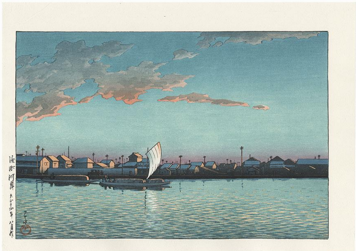
Tresnitt, Japan. Kawase Hasui: Hama-Sho Riverbank, ca 1925

Tid og sted: Torsdag 7. desember klokken 18 i i Røde sal på Schafteløkken, Zahlkasserer Schafts plass 1