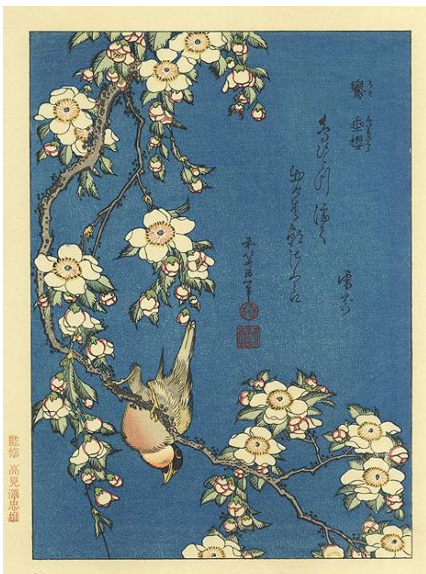
Reprint av japansk tresnitt av Hokusai (1760 - 1849) Bullfinch and Weeping Cherry

Etter lang og temmelig grå vinter er våren endelig her, nå kommer gledene på rad og rekke, som kirsebærblomstringen i byens gater og parker – og medlemsaktiviteter i NSOK.