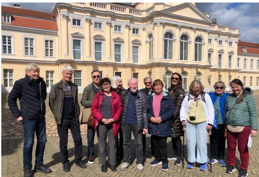
Blide turdeltakere utenfor Charlottenburg slott i Berlin

Tretten medlemmer er nettopp kommet tilbake fra vårens reise til Berlin, elleve av dem var i Dresden først. Kanskje vi får høre litt om turen på neste medlemsmøte?